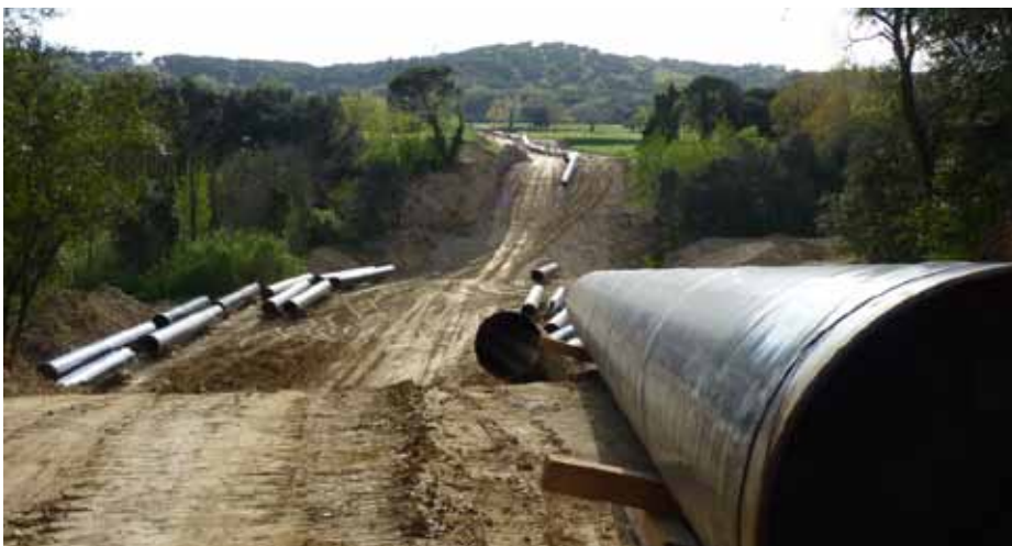
Obres del gasoducte.