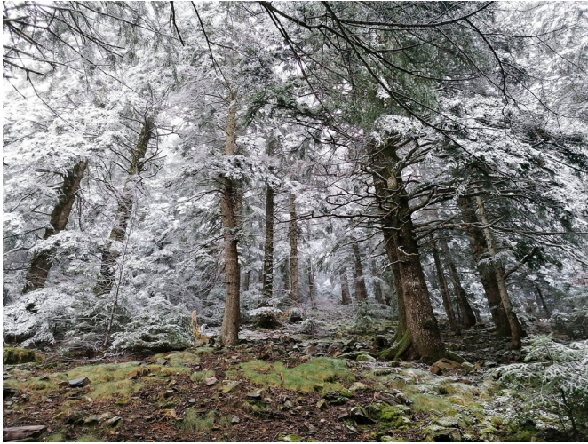
Hivern a l'avededa de Santa Fe

petit país (entitats, associacions, propietaris forestals, clubs, centres culturals, ajuntaments, empreses, etc.) som conscients que cal un canvi radical en la manera d'enfocar els problemes quotidians, encara podem preparar-nos i frenar el cop. Cal, però, que les administracions locals (els nostres ajuntaments) siguin les primeres a donar exemple canviant el tarannà burocràtic que, força cops, les impelleix a seguir fent el mateix de sempre.